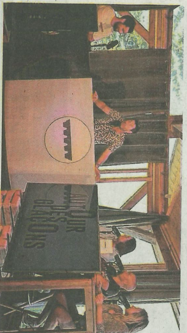
Samеди dernier, le premier épisode de l'émission de l'été Autour des glaçons était finalisé dans le studio de tournage installé au chalet du centre de pilotage des Bergers.

Pour participer à l'émission, contacter l'office de tourisme (info@alpedhuez.com) ou Alpe d'Huez TV (contact@alpe.tv).