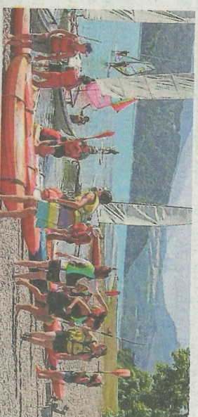
Mardi, il y avait du monde au lac du Monteynard.

Avec les fortes chaleurs, le lac du Monteynard connaît une belle affluence ces derniers jours. Vacanciers, touristes, mais aussi Grenoblois et locaux viennent pratiquer les activités nautiques proposées, découvrir les passerelles himalayennes, ou tout simplement trouver un peu de fraîcheur. Ce mardi, chaleur, soleil et ciel bleu ont attiré la foule, venue pratiquer paddle, canoë ou catamaran, et profiter des pallotés de plage et restaurant, pris d'assaut. De quoi annoncer une belle saison ! Le bilan sera connu lors de l'assemblée générale du Sivom du lac, au cours du mois d'octobre.