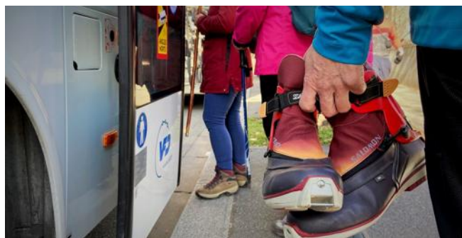
La station du Barioz, sur la commune de Crêts-en-Belledonne, offre une diversité de pratiques entre les raquettes, le ski de fond ou encore le ski de randonnée.